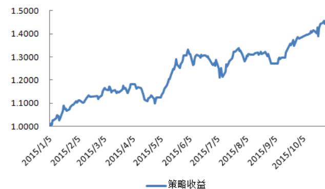
图3：量化选股对冲策略收益表现